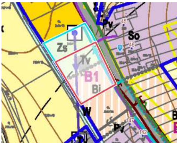
Obrázek 3: výřez koordinačního výkresu - p.č. 249/19, 249/32