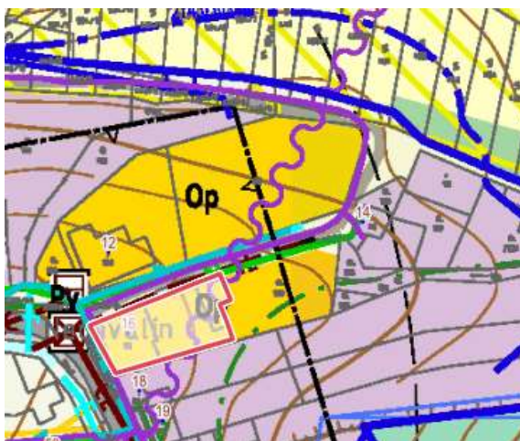
Obrázek 2: výřez koordinačního výkresu - p.č. st.93