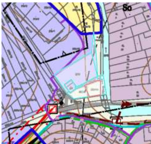
Obrázek 5: výřez koordinačního výkresu – pozemky přestavby pro bytové domy