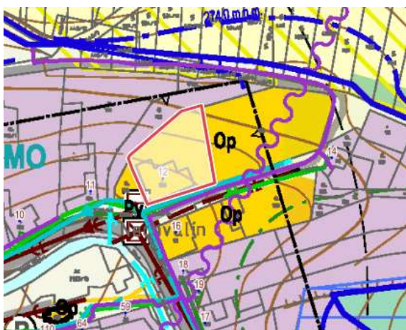
Obrázek 1: výřez koordinačního výkresu - p.č. st.100