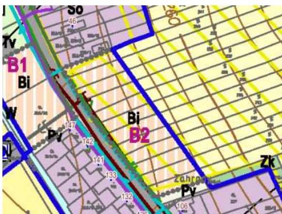
Obrázek 4: výřez koordinačního výkresu – plocha Bi B2